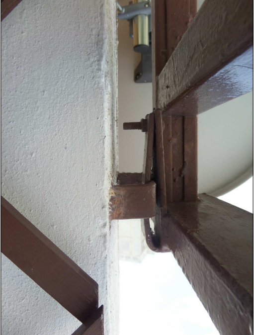
PŮVODNÍ KOTVENÍ: HORNÍ ČÁST, BOČNÍ POHLED