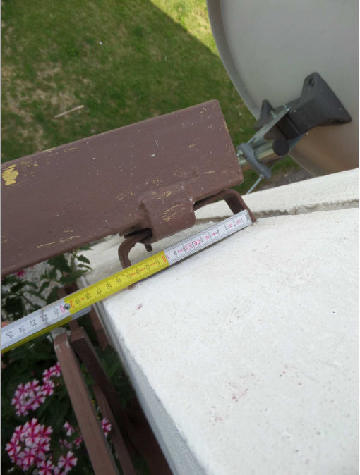
PŮVODNÍ KOTVENÍ: HORNÍ ČÁST, HORNÍ POHLED